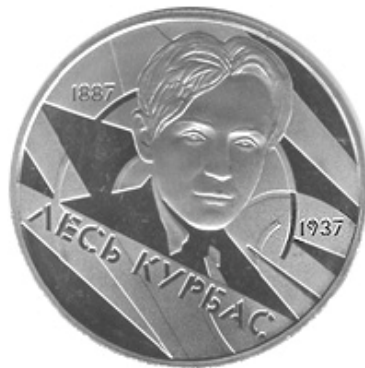
монета (coin) на якій зображений Лесь Курбас