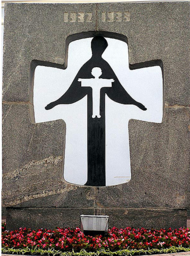
пам'ятник жертвам Голодомору в Києві