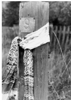
пам'ятка Василеві Стус у концентраційному таборі де він помер