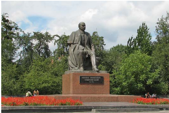
пам'ятник Михайла Коцюбинського

Михайло Коцюбинський належить до найвизначніших письменників кінця 19-го ст. і початку 20-го ст. Головна тема його творів - соціальна несправедливість , наприклад твір Fata morgana . В цьому творі Коцюбинський пише про соціальну несправедливість в українському селі під владою Росії на початку 20-го століття.