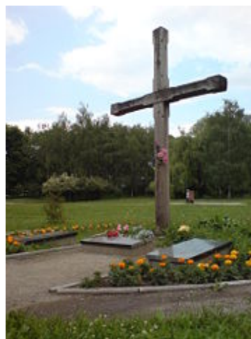
хрест на могилі Олени Теліги в Києві (Бабин Яр)