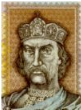
Князь Володимир Великий

був митрополитом в той час, коли князем був Ярослав Мудрий. Він був першим українським митрополитом, бо до того часу митрополити в Україні були з Греції. В цьому творі митрополит Іларіон порівнює Старий і Новий Завіт (Testament). Старий Завіт він називає закон (law), а Новий Завіт він називає Благодать (mercy). До цього твору митрополит Іларіон додав Похвалу Князеві Володимирові . Він хвалить князя Володимира за те, що він завів християнство в Україні. Автор гордий за свою державу і пише, що Володимир Великий був князем не у якійсь невідомій державі про яку ніхто не знає, а в українській державі, про яку знають у світі.