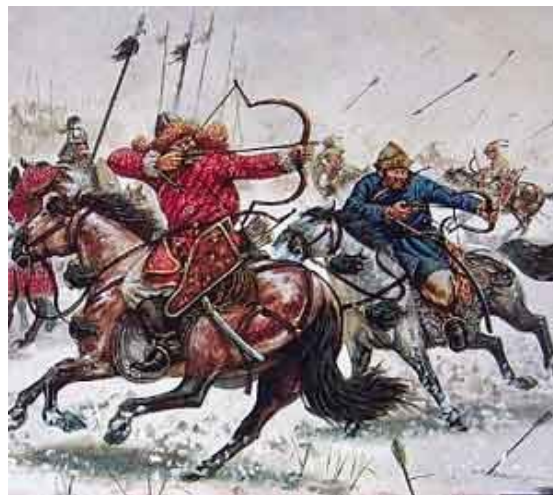
татари нападають на Київську Русь

1240-го року татари знищили Київ і Київська держава перестала існувати. Міста, церкви і монастирі були зруйновані і багато пам'яток української культури було знищено.