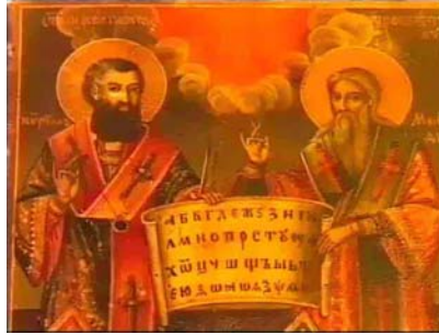
св. Кирило і Methodій