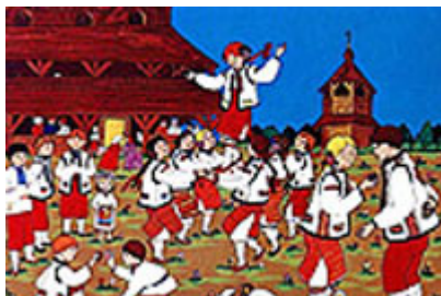
молодь виконує гагілки на Великдень

В літі святкували свято Купала і тоді співали купальні пісні . Були ще пісні пов'язані з життям родини так як весільні і похоронні пісні .