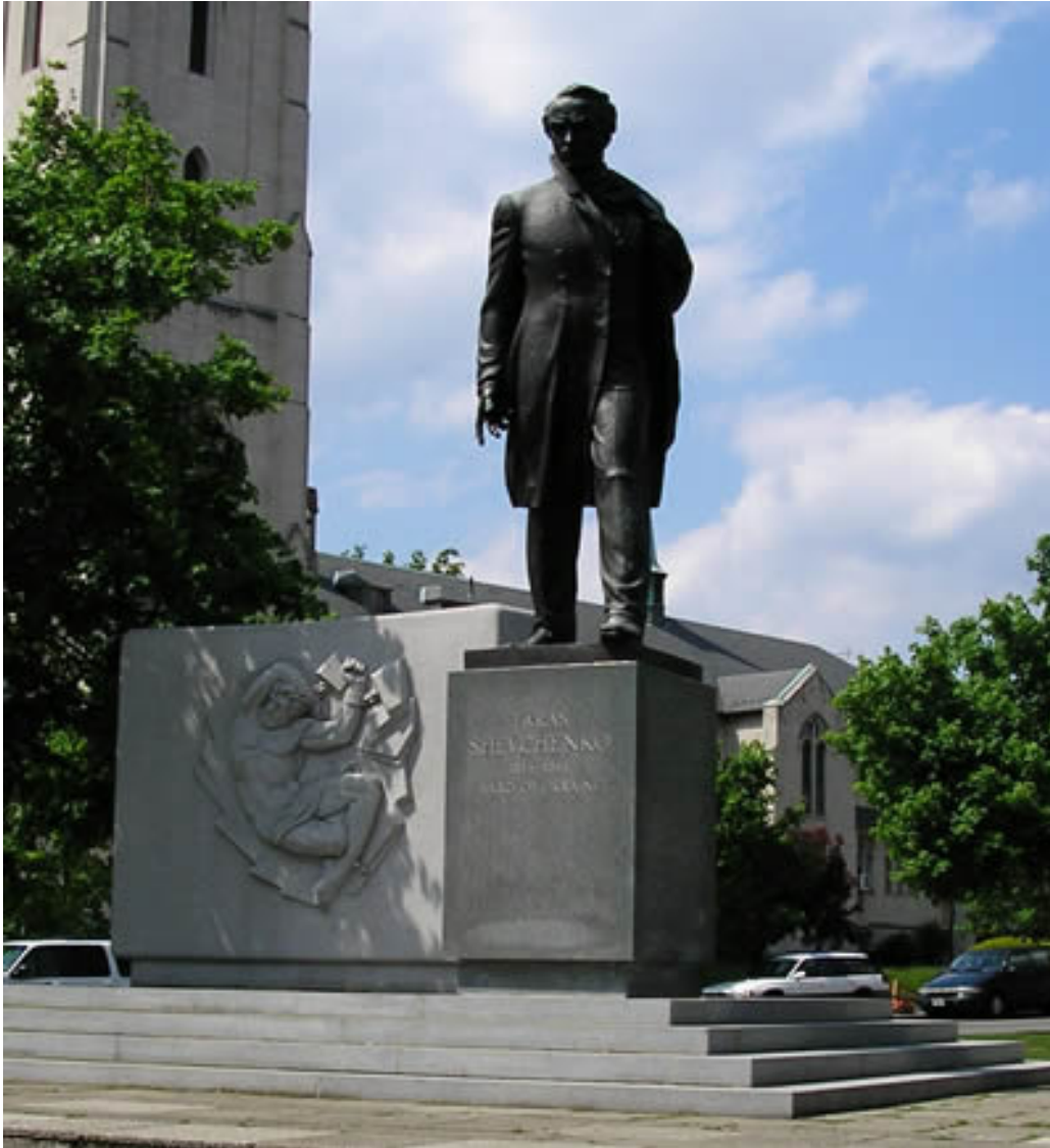
пам'ятник Шевченка у Вашингтоні