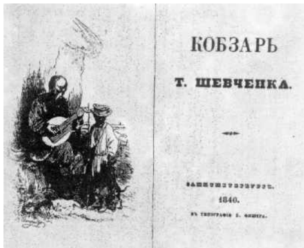
Кобзар – виданий 1840 р.

В 1840-ому році вийшов друком перший Кобзар - збірка його віршів. Московські критики неприхильно поставились до Кобзаря , але в Україні Кобзар викликав велике захоплення.